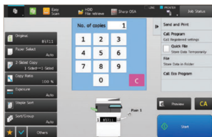
Con "botón de detalles" tendrá acceso a las características avanzadas