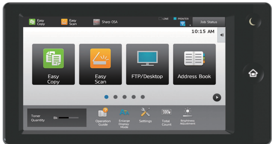
Pantalla táctil a color de 7 "(medida diagonal).