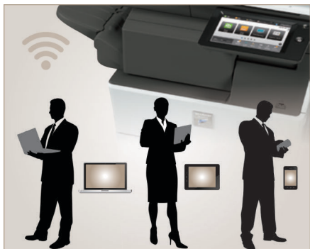
La interfaz de red inalámbrica incluida para el escaneo y la impresión desde dispositivos móviles.